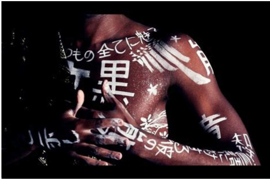
Smaïl Kanouté, Yasuke Korusan

L.M. : Justement, l'histoire de Yasuke Kurosán est incroyable, comment s'est passé cette transition de la communauté afro-américaine à cette première occurrence d'un afro-japonais bien avant l'arrivée des militaires américain après la seconde guerre mondiale ?