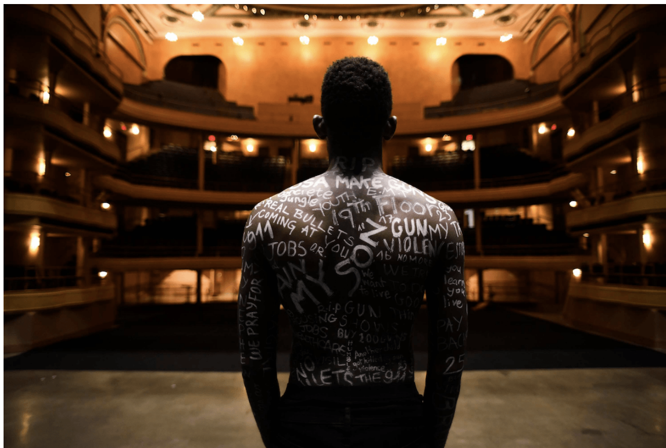
Smail Kanouté, Never Twenty One © Smail Kanouté

ENTRETIEN / SMAÏL KANOUTÉ (HTTPS://WEB.ARCHIVE.ORG/WEB/20240414144851/HTTP://POINTCONTEMPORAIN.COM/TAG/SMAIL-KANOUTE/) PAR LÉO MARIN (HTTPS://WEB.ARCHIVE.ORG/WEB/20240414144851/HTTP://POINTCONTEMPORAIN.COM/TAG/LEO-MARIN/)