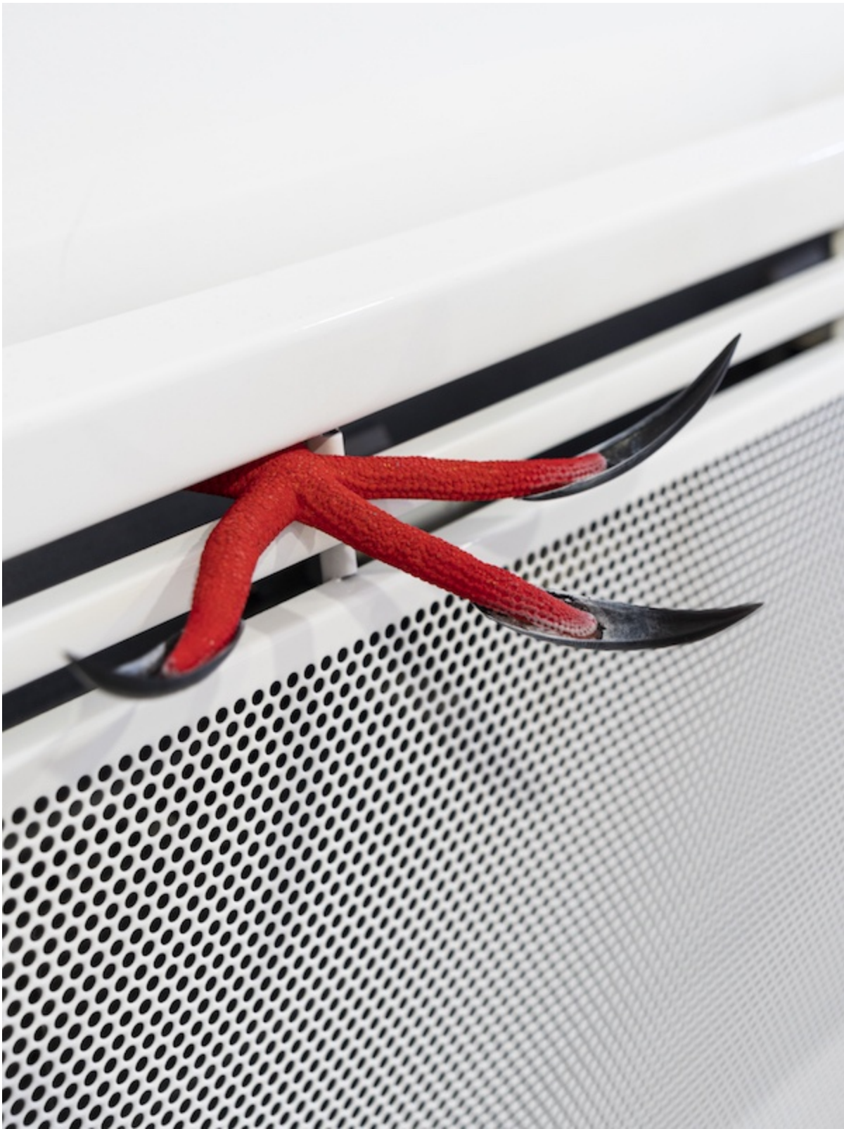
Léo Fourdrinier, I Feel Alive and the world I'll Turn it Inside Out, Yeah (detail), 2020, Etoile de mer peinte, faux ongles, radiateur - 68 x 44 x 24 cm