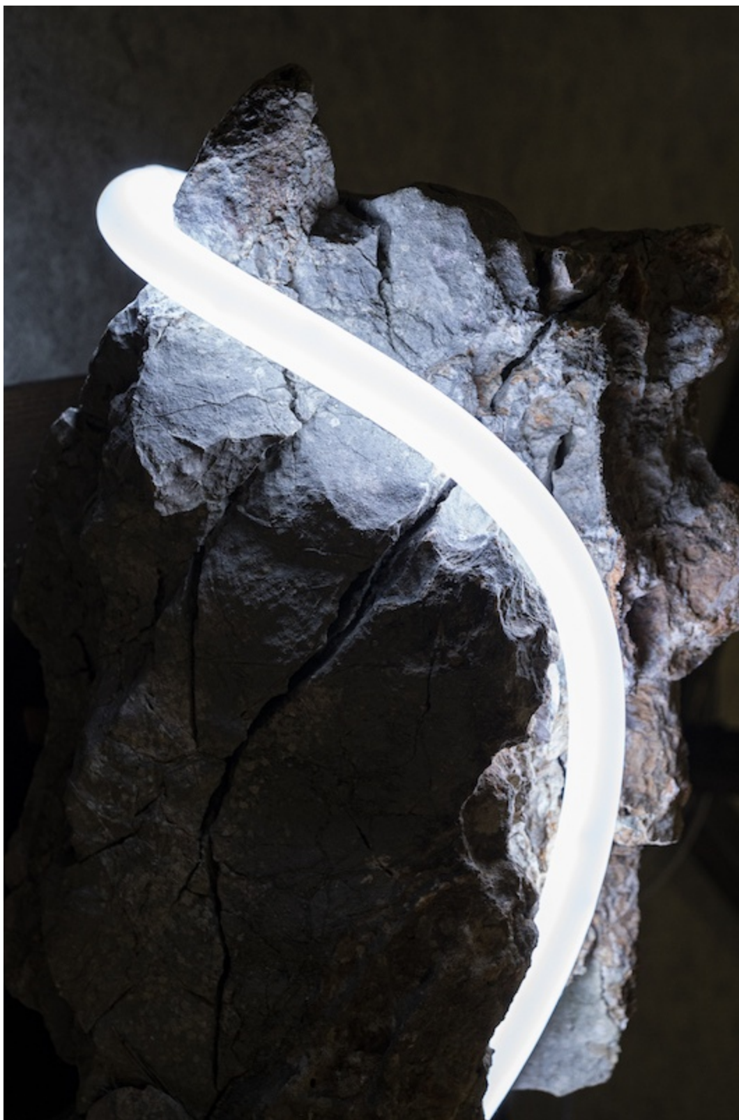
Léo Fourdrinier, Collision (In Solitude of Memory) (detail), 2019, Roche calcaire, led, bois, prise jack – dimensions variables