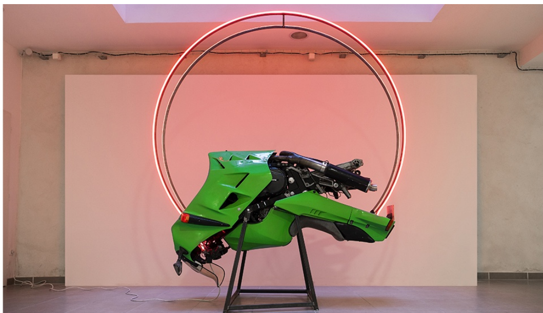
Léo Fourdrinier, Love Like a Sunset , 2020 Kawasaki 1000 RX, acier, led - 180 x 90 x 250 cm

EN DIRECT / EXPOSITION PULSE , DE LÉO FOURDRINIER ( HTTPS://WEB.ARCHIVE.ORG/WEB/20240329230712/HTTP:// POINTCONTEMPORAIN.COM/TAG/LEO-FOURDRINIER/ GALERIE L'AXOLOTL TOULON, JUSQU'AU 02 MAI 2020