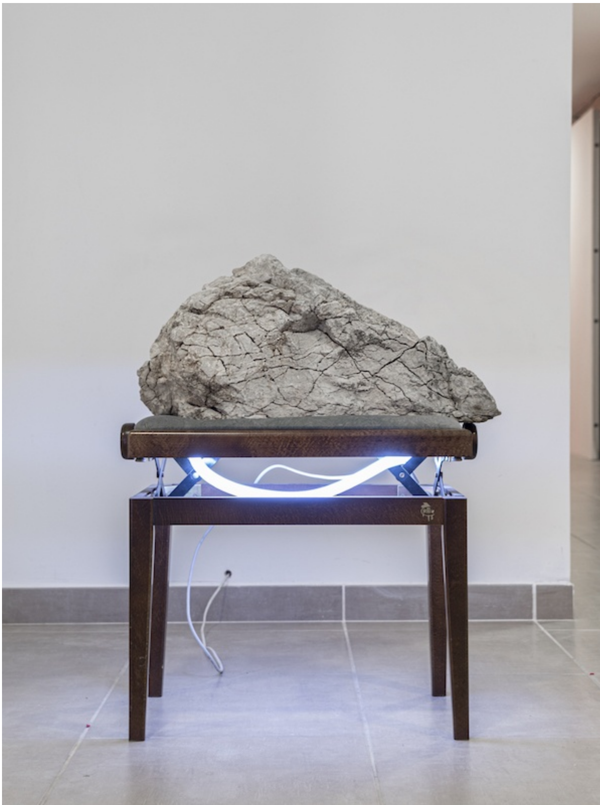
Léo Fourdrinier, Collision (In Solitude of Memory) (detail), 2019, Roche calcaire, led, bois, prise jack – dimensions variables