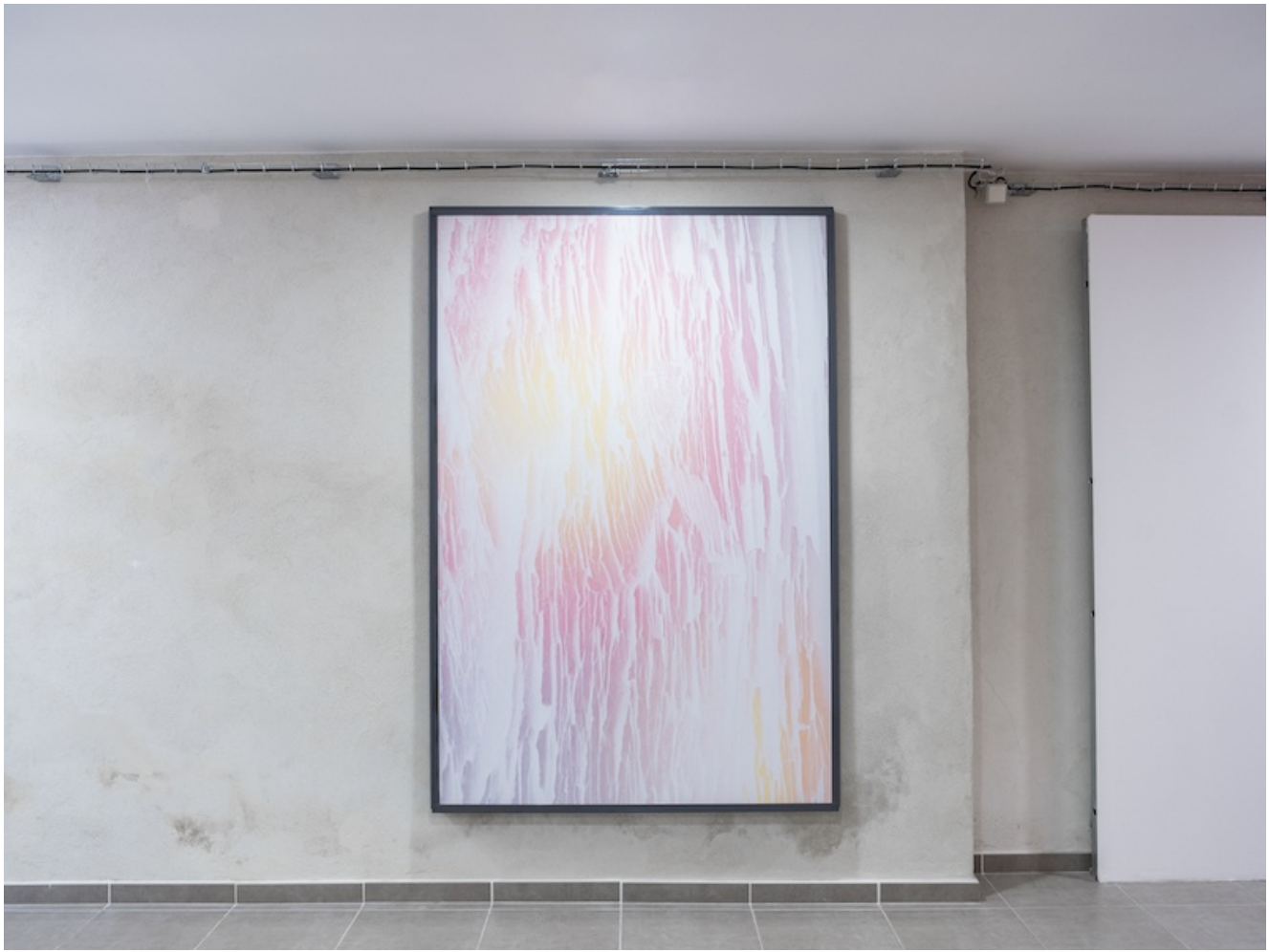
Léo Fourdrinier, Let in the Light, 2020, Impression sur vinyle contrecollé, dibond alluminium - 144 x 212 x 6 cm