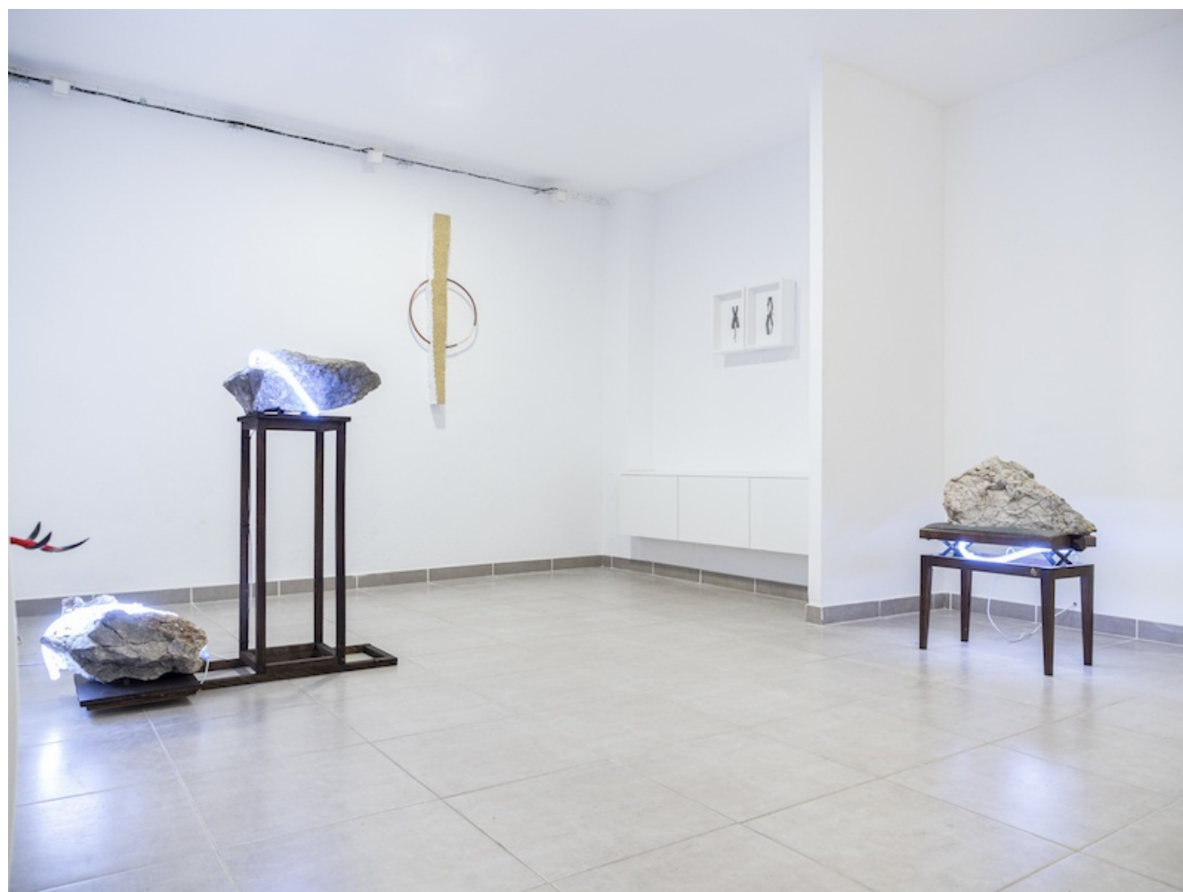
Vue d'exposition PULSE, de Léo Fourdrinier Galerie l'Axolotl Toulon jusqu'au 02 mai 2020

8 Écrivain, sociologue et critique littéraire français. Il s'est, entre autres choses, interrogé sur la sympathie qui paraît régner entre les formes complexes du monde minéral et les figures de l'imaginaire humain. Le Fleuve Alphée et L'Écriture des pierres , notamment, explorent cette relation.