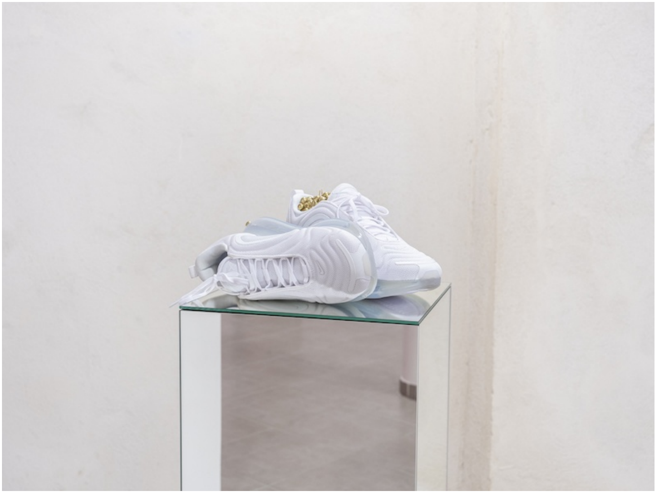
Léo Fourdrinier, Go Tell Fire to the Mountain, 2020, Nike AirMax 720, clous tapissiers laitonnés, miroirs – 32 x 114 x 29 cm