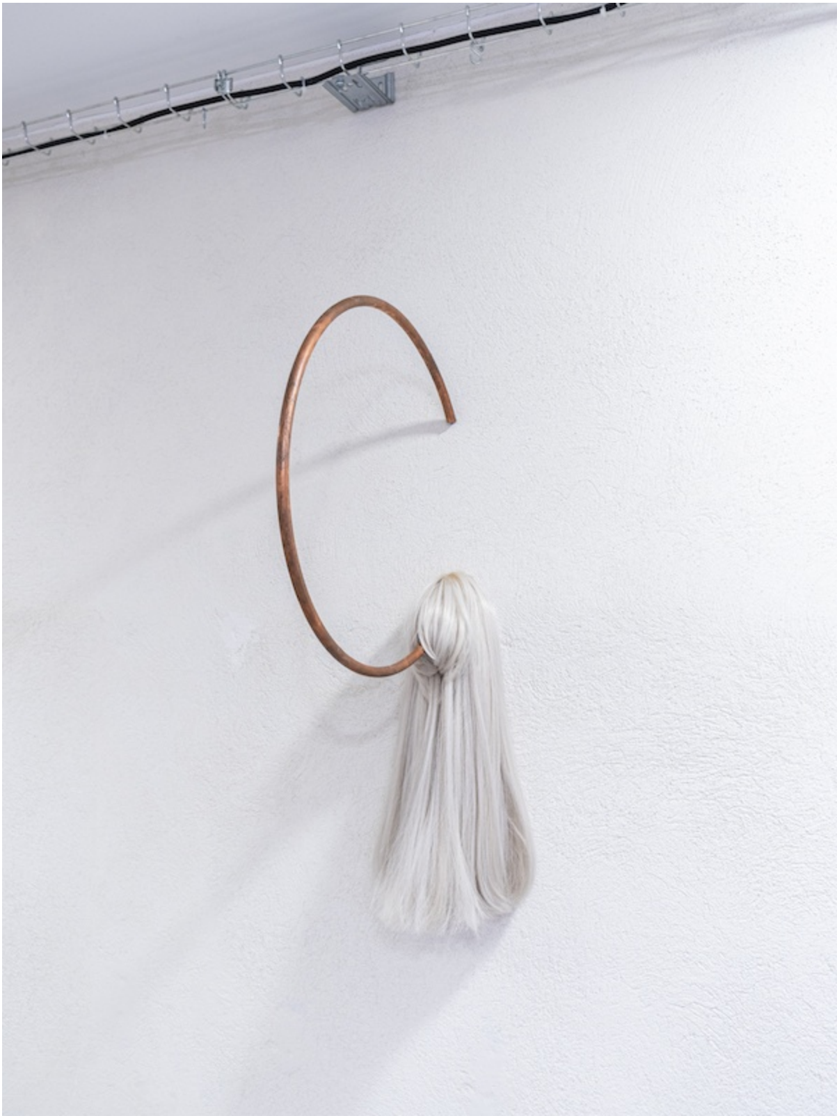
Léo Fourdrinier, Radio Silence, 2020, Cheveux sythétiques, cuivre – 20 x 70 x 45 cm