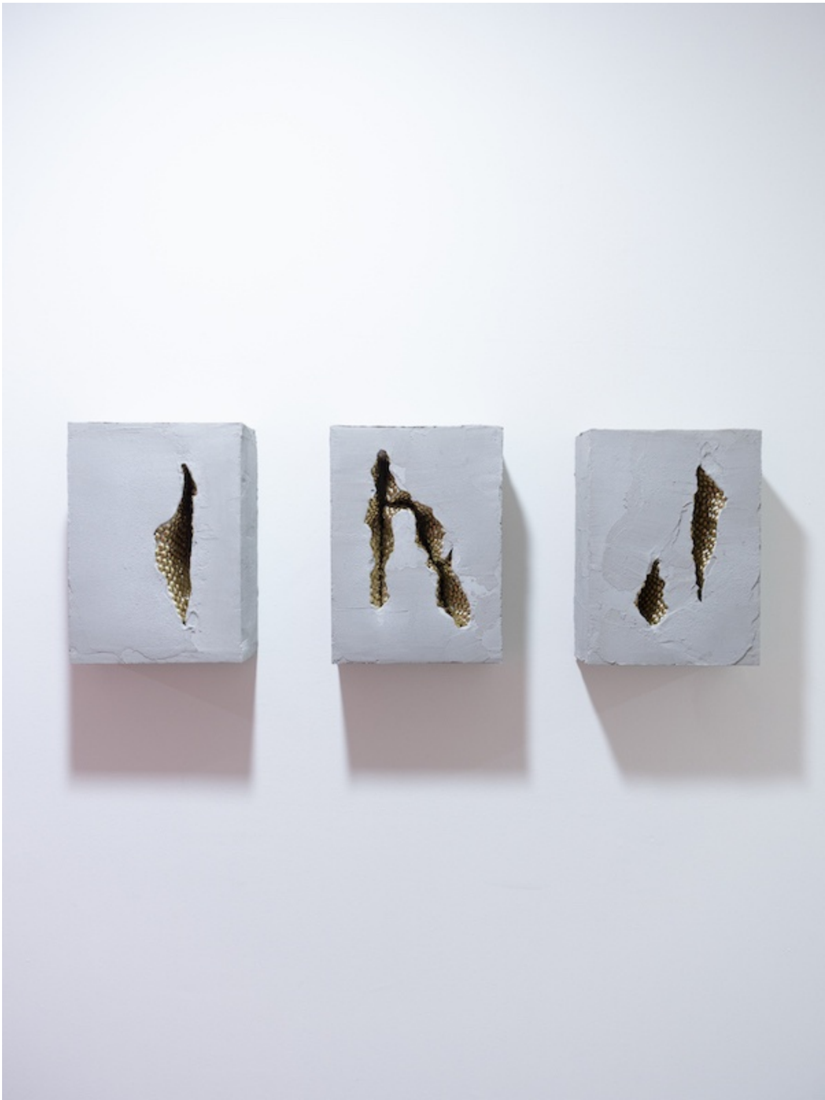
Léo Fourdrinier, Light Through the Veins (série), 2020, Béton, clous tapissiers laitonnés, bois, polyester extrudé, - 25 x 34 x 10 cm (chacun)