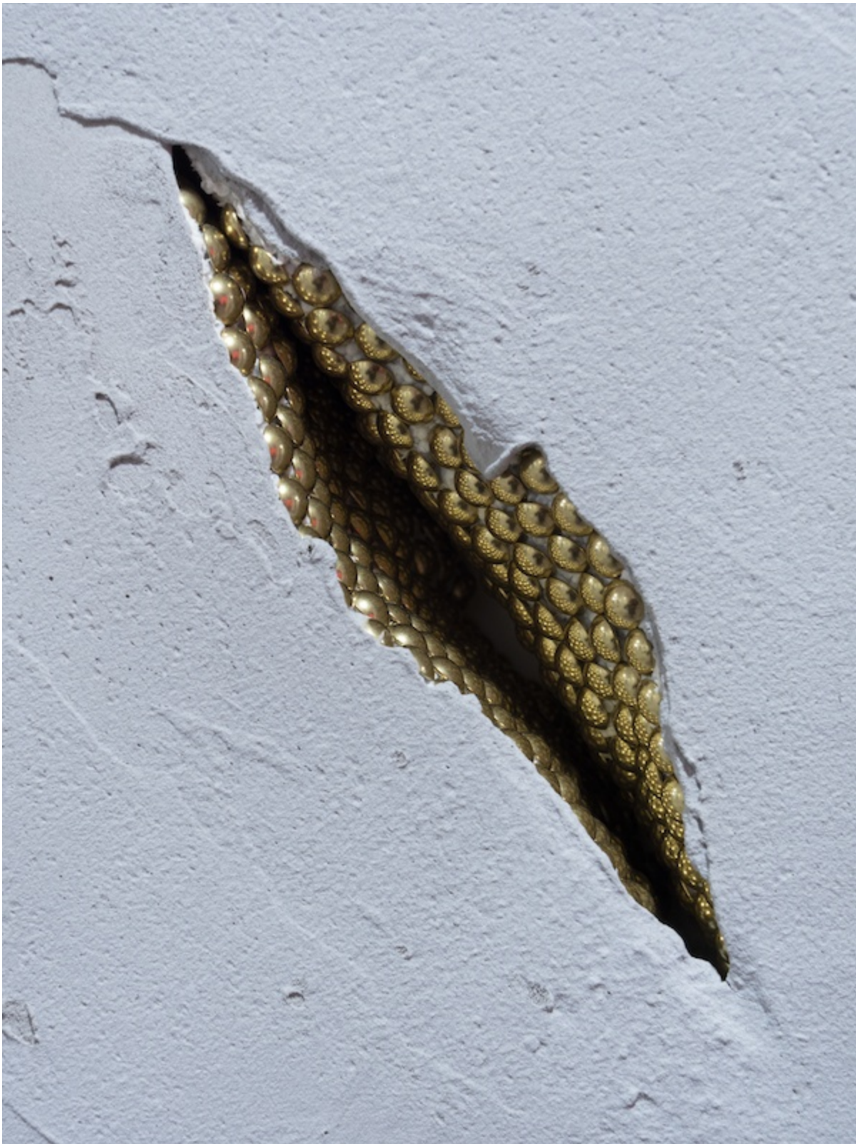
Léo Fourdrinier, Light Through the Veins (série) (detail), 2020, Béton, clous tapissiers laitonnés, bois, polyester extrudé, - 25 x 34 x 10 cm (chacun)