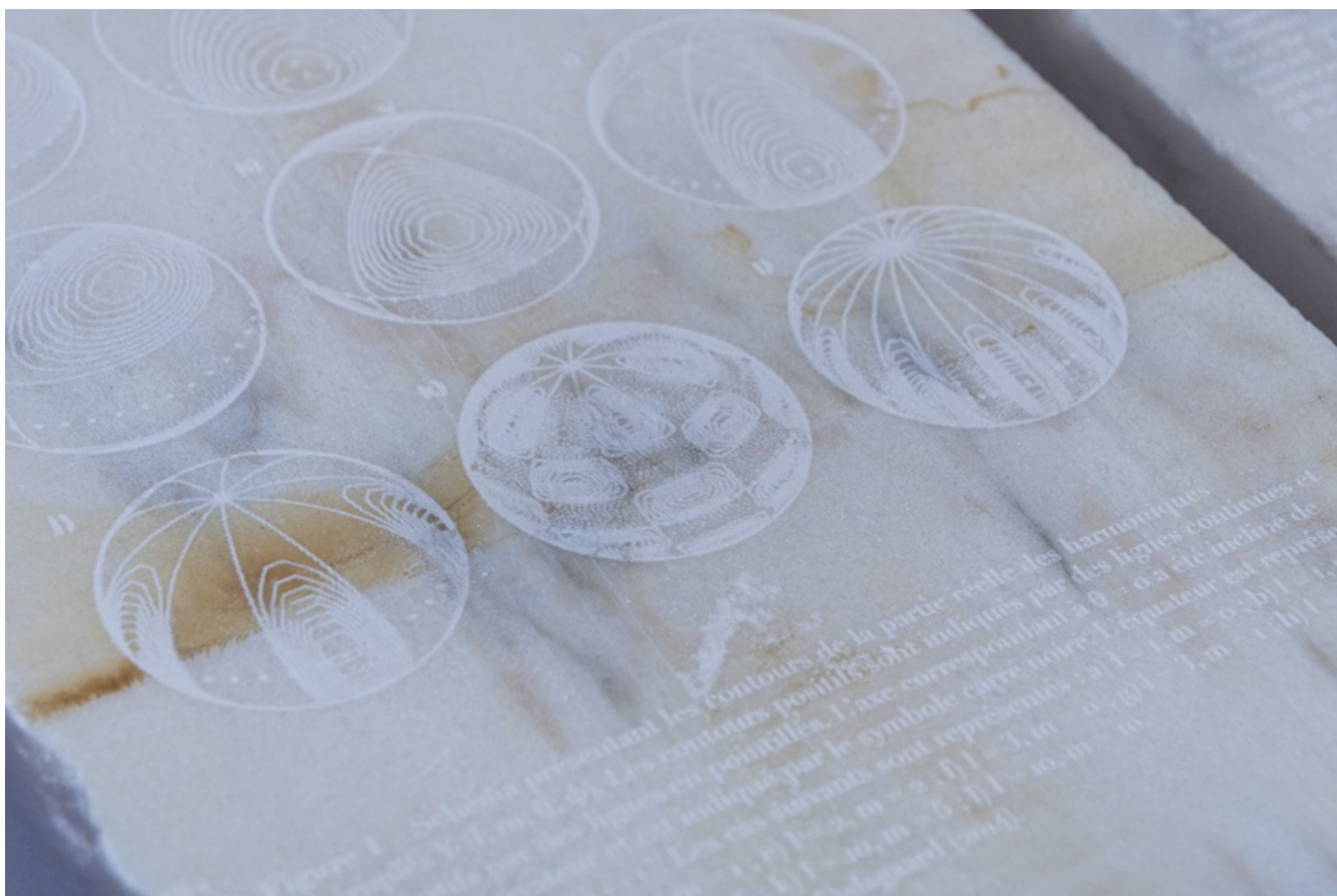
Léo Fourdrinier, Delta Marble Record (detail), 2020, Marbre, verre, acier – 140 x 80 x 74 cm