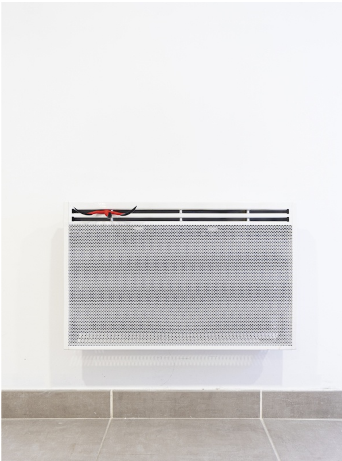
Léo Fourdrinier, I Feel Alive and the world I'll Turn it Inside Out, Yeah, 2020, Etoile de mer peinte, faux ongles, radiateur – 68 x 44 x 24 cm