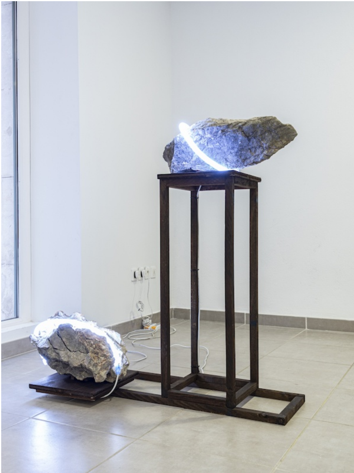
Léo Fourdrinier, Collision (In Solitude of Memory) (detail), 2019, Roche calcaire, led, bois, prise jack – dimensions variables