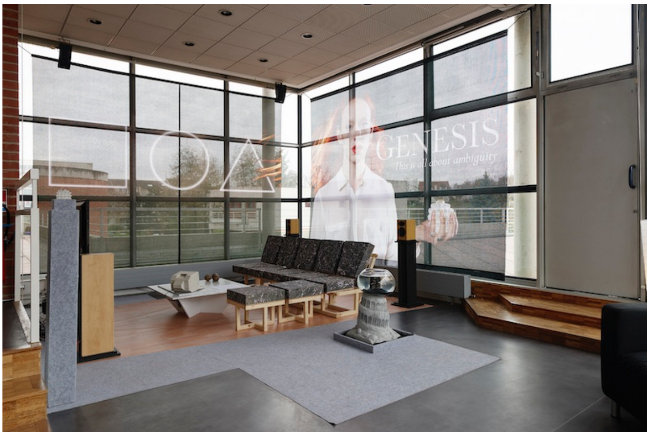
Tony Regazzoni, Living on Video , 2016

Outre le lien affectif que j'entretiens avec ces discothèques, leur patrimoine historique et architectural m'interpelle car je me rends compte de l'importance sociale et politique qu'elles véhiculent aujourd'hui, tout comme l'histoire du kitsch me semble être un terrain intéressant pour critiquer voire lutter contre le modèle bourgeois dominant et bien-pensant ce qui peut paraître paradoxal, quand on sait que le kitsch est né de la bourgeoisie.