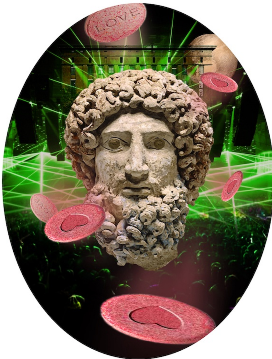
Tony Regazzoni, The Lost Opera (Pluto) , 2018

Impression sur Dibond® 75 x 50 cm © Tony Regazzoni - ADAGP, 2018